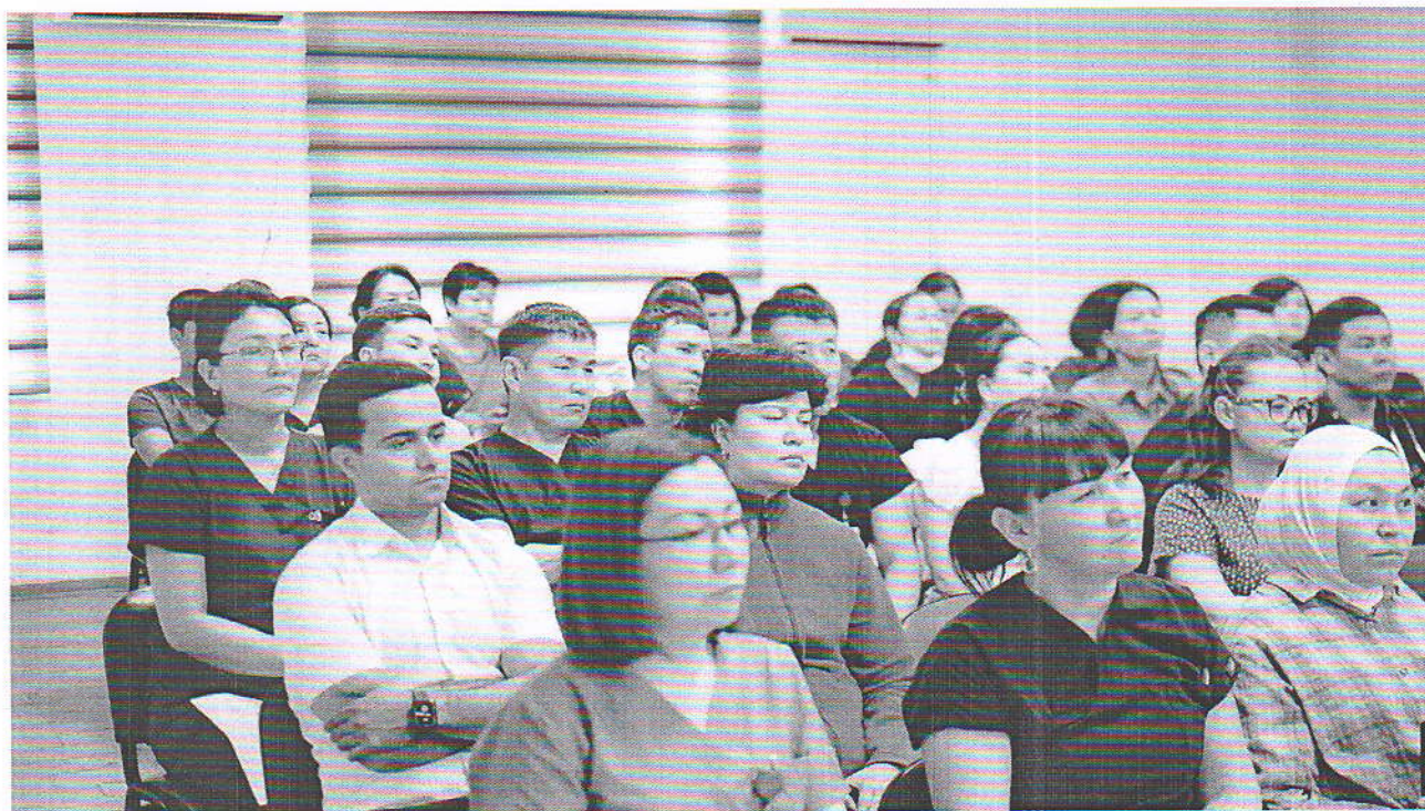
Фото с семинара